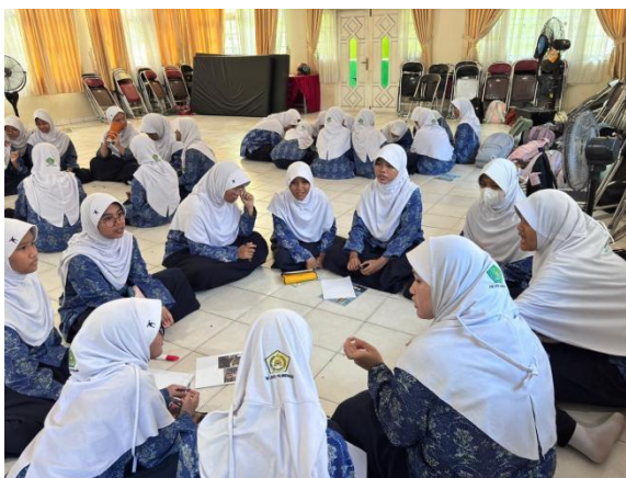
Gambar 4. Siswa menulis deskripsi profesi berdasarkan gambar

Selama kegiatan berlangsung, siswa aktif terlibat dalam setiap tahapan pembelajaran yang meliputi pengenalan kosakata profesi, penulisan deskripsi profesi berdasarkan gambar, presentasi hasil tulisan, serta kegiatan menyimak saat kelompok lain melakukan presentasi.