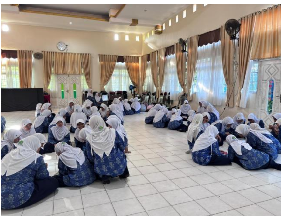
Gambar 5. Siswa mencatat presentasi hasil tulisan oleh kelompok lain

Selama kegiatan berlangsung, siswa aktif terlibat dalam setiap tahapan pembelajaran yang meliputi pengenalan kosakata profesi, penulisan deskripsi profesi berdasarkan gambar, presentasi hasil tulisan, serta kegiatan menyimak saat kelompok lain melakukan presentasi.