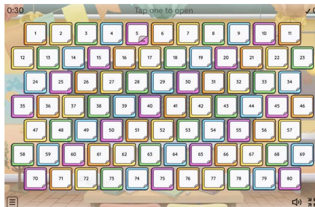
Gambar 2. Tampilan depan open the box

Setelah seluruh kelompok selesai mempresentasikan hasil karyanya, kegiatan dilanjutkan dengan sesi permainan edukatif seperti Wordwall (open the box) sebagai bentuk penguatan materi. Pada tahap ini, fasilitator menampilkan permainan tersebut melalui proyektor dan memberikan kesempatan kepada setiap kelompok untuk memilih satu angka dari 1 hingga 80. Setiap angka berisi pertanyaan terkait tema profesi dan pekerjaan yang harus dijawab oleh kelompok dalam waktu tiga menit. Permainan ini dirancang untuk menguji pemahaman siswa terhadap kosakata profesi yang telah dipelajari secara interaktif dan menyenangkan. Kelompok yang berhasil memperoleh poin tertinggi dinyatakan sebagai pemenang dan diberikan hadiah apresiasi dari fasilitator.