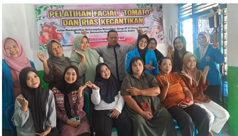
Gambar 3. Pelatihan Rias kecantikan bagi warga Dusun Pluncing