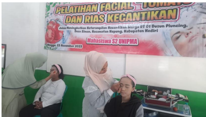
Gambar 2. Pelatihan Rias Kecantikan