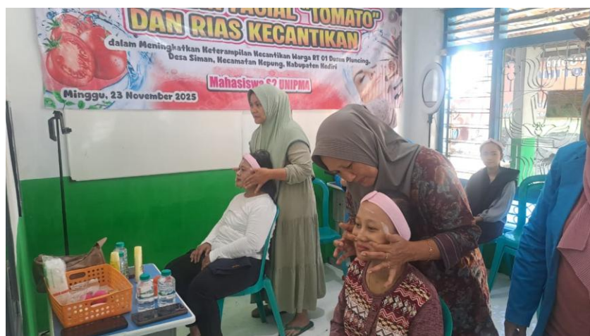
Gambar 1. Pelatihan facial tomato bagi warga Dusun Pluncing